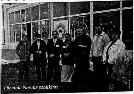
Füzulidə Novruz şənlikləri

lər, xüsusilə, tapmacalar, yanıltmaclar mövcuddur, yaranıb, yaşayır, yenə də yaranmaqdadır.