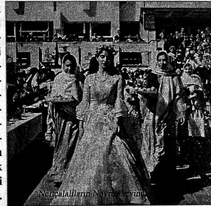
Neftçalılardan Novruz sevinci

Novruzla bağlı atalar sözü, lətifə, rəvayət-